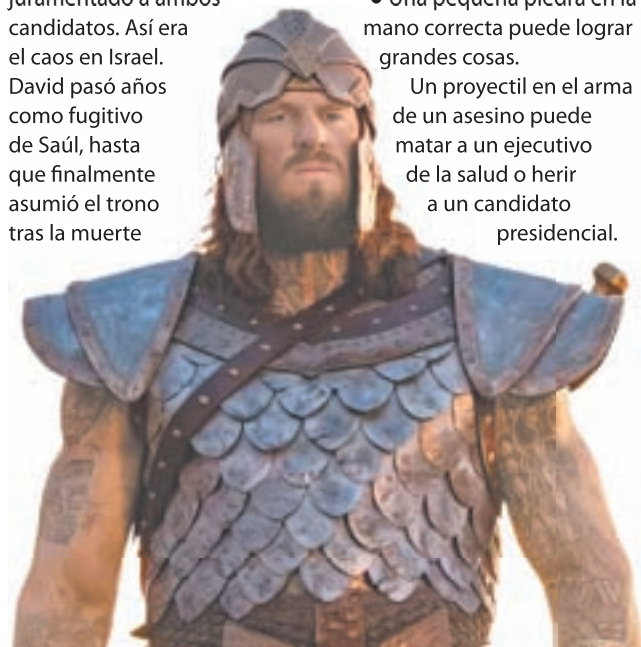
Goliat (Martyn Ford).

Consideremos un paralelo moderno: la controversia en torno a los resultados de las elecciones presidenciales de EE.UU. en 2020 sigue latente. Imaginemos que el Congreso hubiera declarado dos ganadores y el presidente del Tribunal Supremo hubiera juramentado a ambos candidatos. Así era el caos en Israel. David pasó años como fugitivo de Saúl, hasta que finalmente asumió el trono tras la muerte