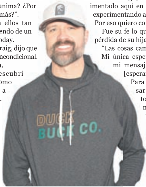
Walker Hayes en el 2025 Ruffles NBA All-Star Celebrity Game en Oakland, California.