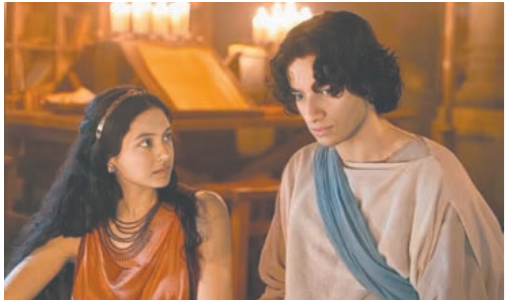
La princesa Mychal (Indy Lewis) y David (Michael Iskander) protagonizan La Casa de David, ahora disponible en Amazon Prime.

No importa en qué punto de tu camino te encuentres, ya sea en la duda, el miedo o la búsqueda de la paz, estás invitado a refugiarte en el amor de Dios. Para comenzar esta nueva vida, consulta el recuadro titulado Cómo me hago cristiano en la página 7.