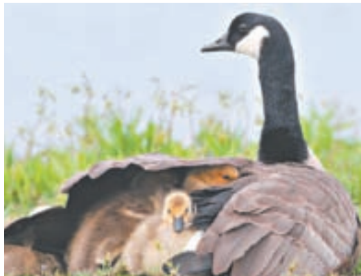
Crías cobijadas bajo el ala de su madre.

Estos versículos evocan la imagen de una madre pájaro que protege a sus polluelos bajo su ala. Corren hacia ella porque saben que los