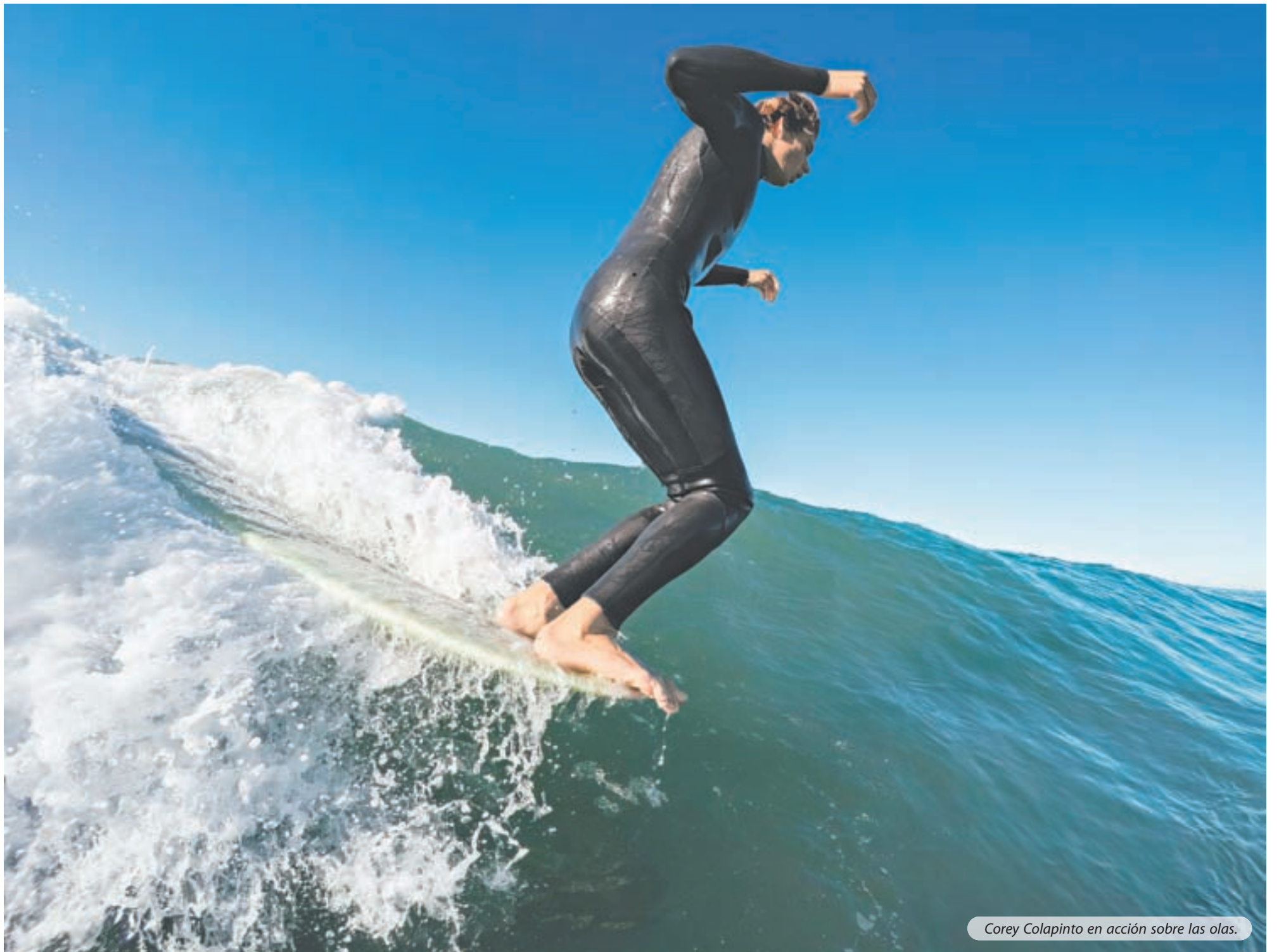
Corey Colapinto en acción sobre las olas.