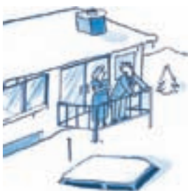
“Good thing we didn't sell the dog sled.”